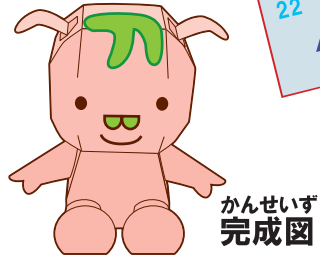
かんせいず 完成図